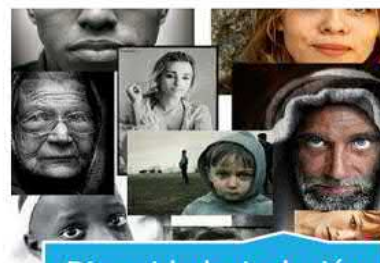
Diversidad e inclusión social