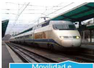
Movilidad e infraestructuras de comunicación

La mejora de las infraestructuras de comunicación de Almería es uno de uno de sus principales retos de futuro, afectando no sólo a la mejora de las carreteras, sino del tren (AVE, corredor mediterráneo, ...), del puerto (papel en el Mediterráneo, integración con la ciudad, logística, ...) y del aeropuerto.