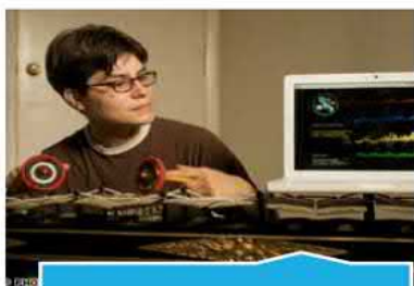
Innovación y smartcity