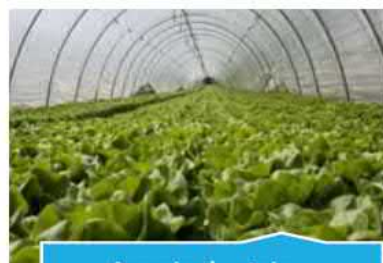
Agroindustria y bioindustria