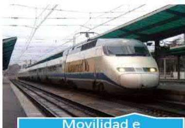
Movilidad e infraestructuras de comunicación