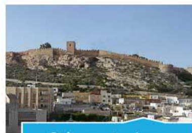
Cultura y turismo sostenible