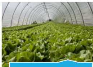
Agroindustria y bioindustria

La mejora de las infraestructuras de comunicación de Almería es uno de uno de sus principales retos de futuro, afectando no sólo a la mejora de las carreteras, sino del tren (AVE, corredor mediterráneo, ...), del puerto (papel en el Mediterráneo, integración con la ciudad, logística, ...) y del aeropuerto.