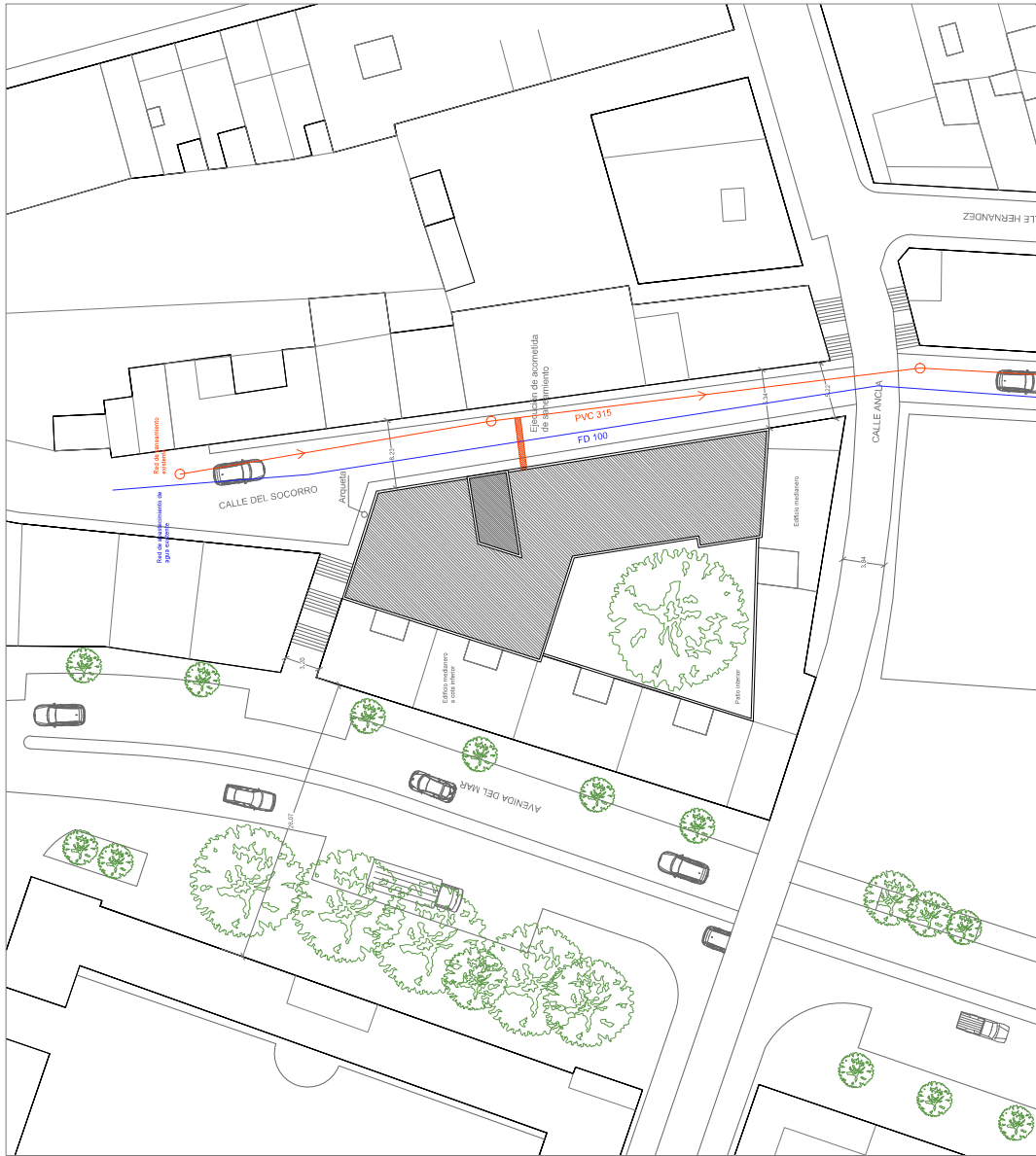
EMPLAZAMIENTO SOBRE PLAN GENERAL DE ORDENACIÓN 1998 ALMERIA ESCALA: 1:200